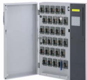
Key Cube 30