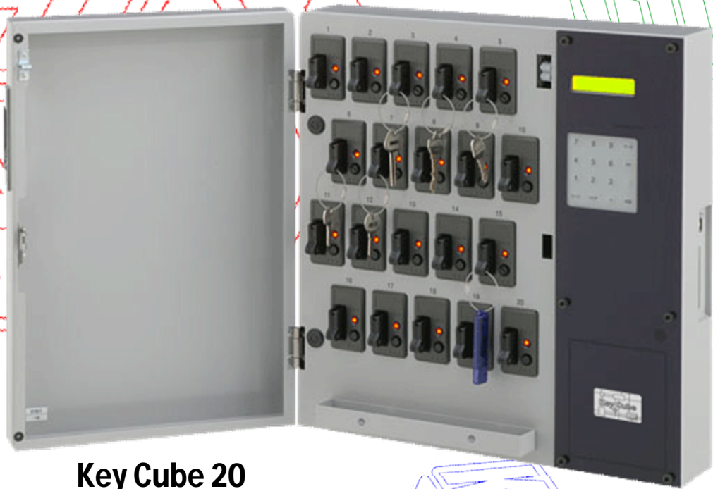
Key Cube 20