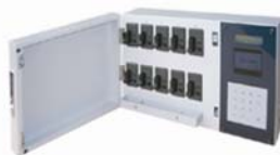
Key Cube 10 (横型)