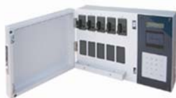
Key Cube 5 (横型)