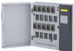
Key Cube 10 (縦型)